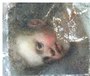
Ange en cours de retouche (en blanc les lacunes à retoucher)