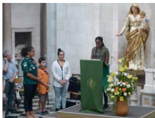
Quelques photos de la messe de rentrée (dimanche 23 septembre)