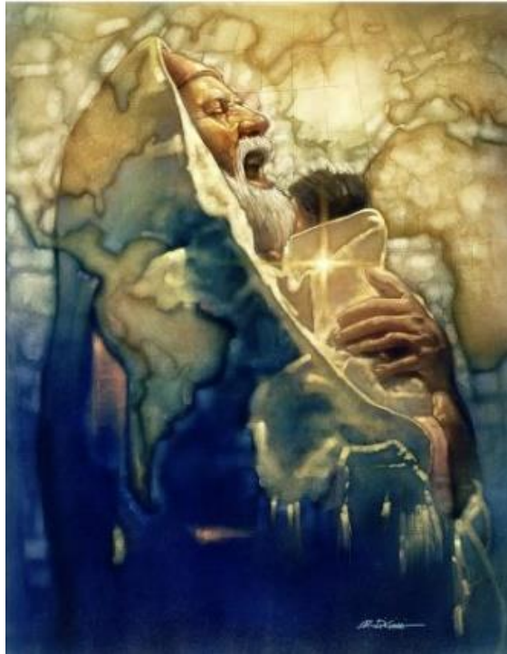
Simeon's moment de Ron DiCianni

À l'occasion de la chandeleur le 2 février, nous vous invitons à relire le cantique de Syméon